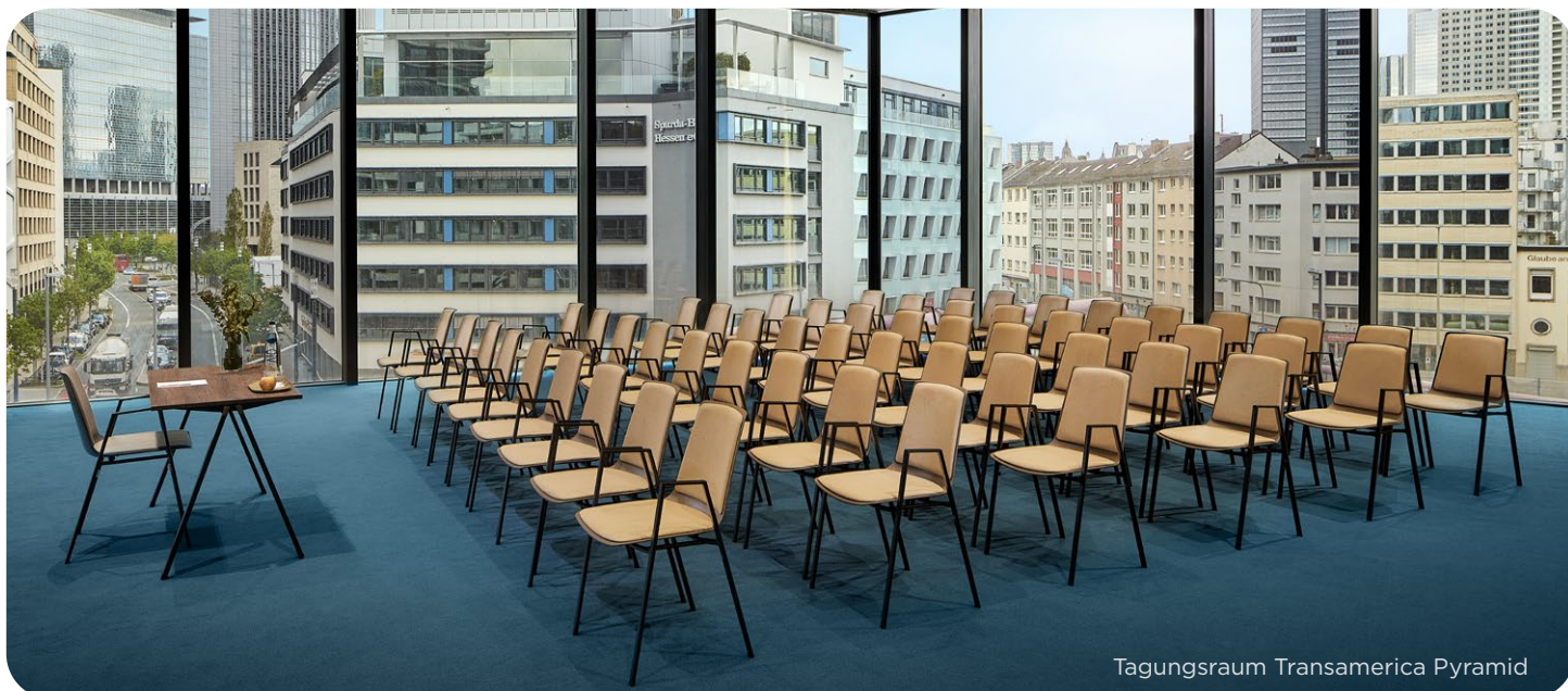
Tagungsraum Transamerica Pyramid